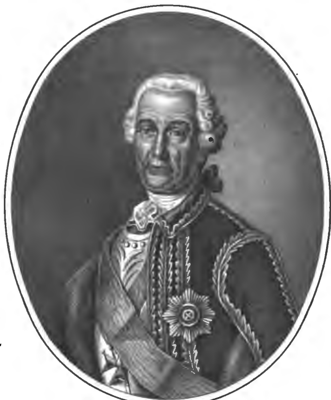
Рис. По Иванову