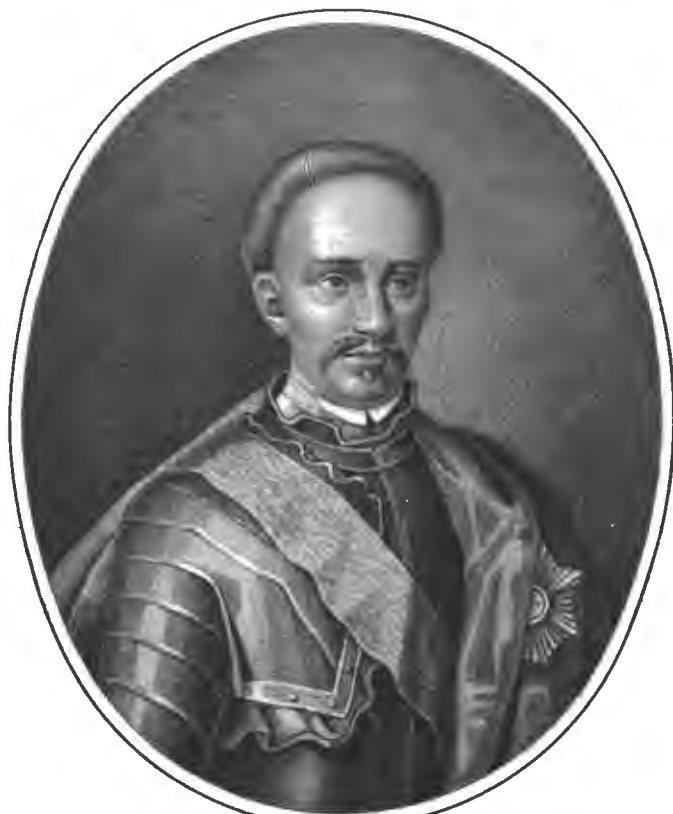
Рис. П.о. Улановъ.