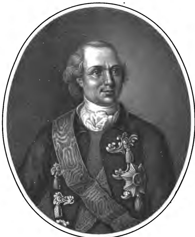
Рис. П. Улановъ