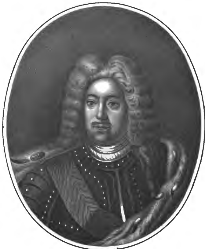
Рис. по Исаеву.