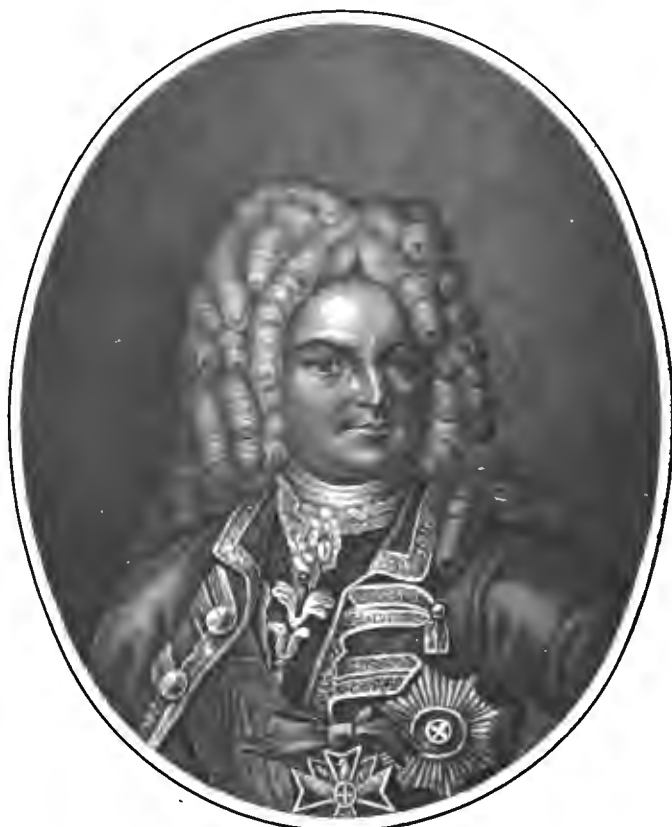
Рис. П. Ивановъ.