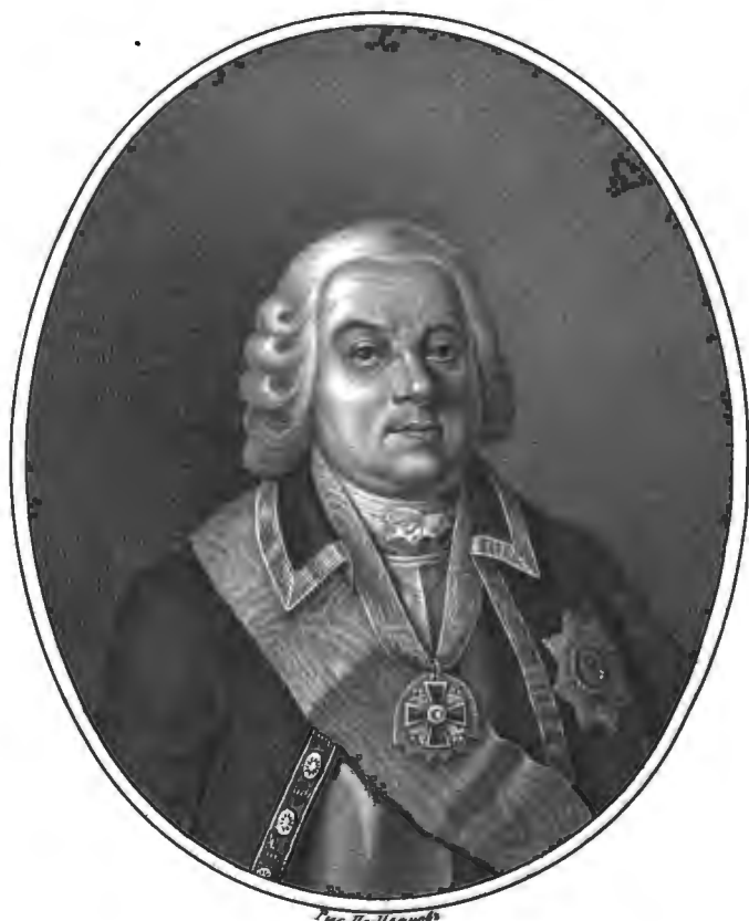
Рис. по Иванову