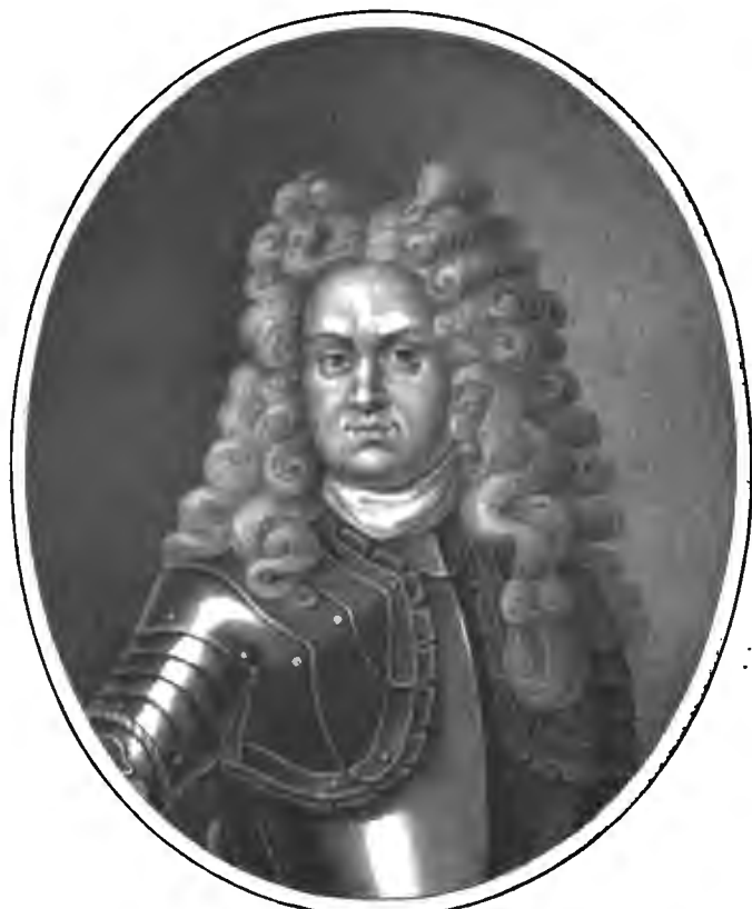
Рис. по Иванове.