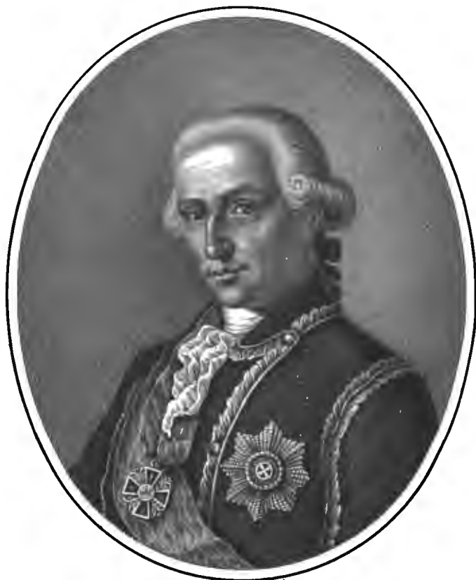
Рис. П. Савинова