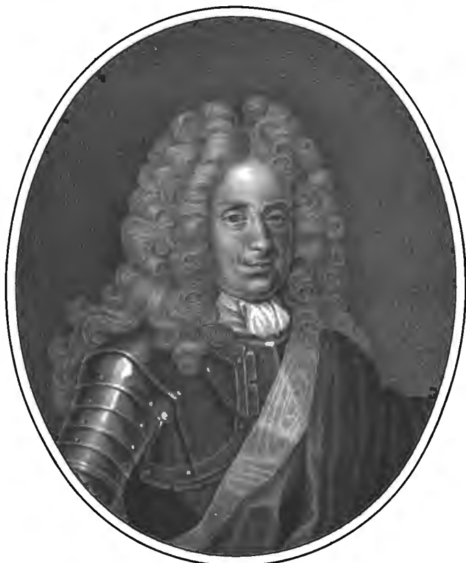
Рис. Гле. Швансера.