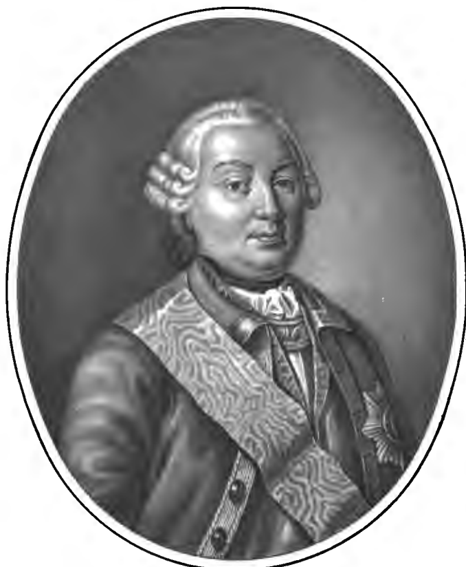
Рис. Па. Ивановъ.